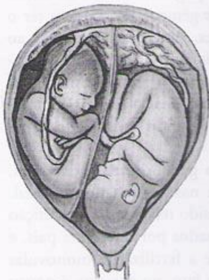
Figura II-2 – Prenhez gemelar monozigótica biâmnica. Placenta e cório únicos. Âmnio duplo (Briquet, 1939).