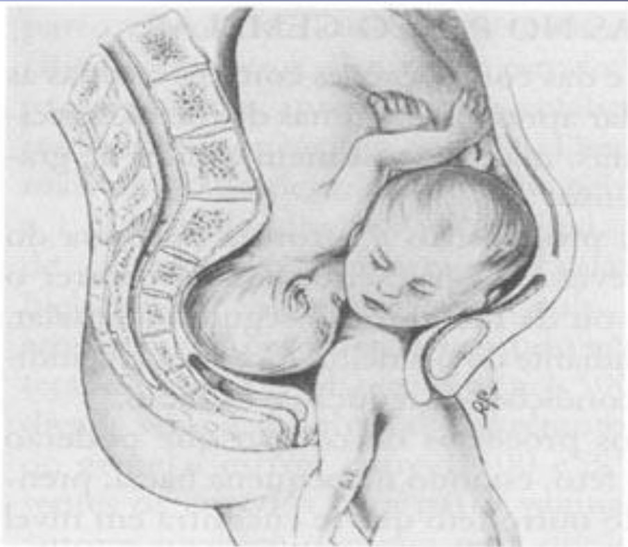
Figura II-10 – Colisão cefálica em prenhez gemelar (Uranga Imaz, 1970).