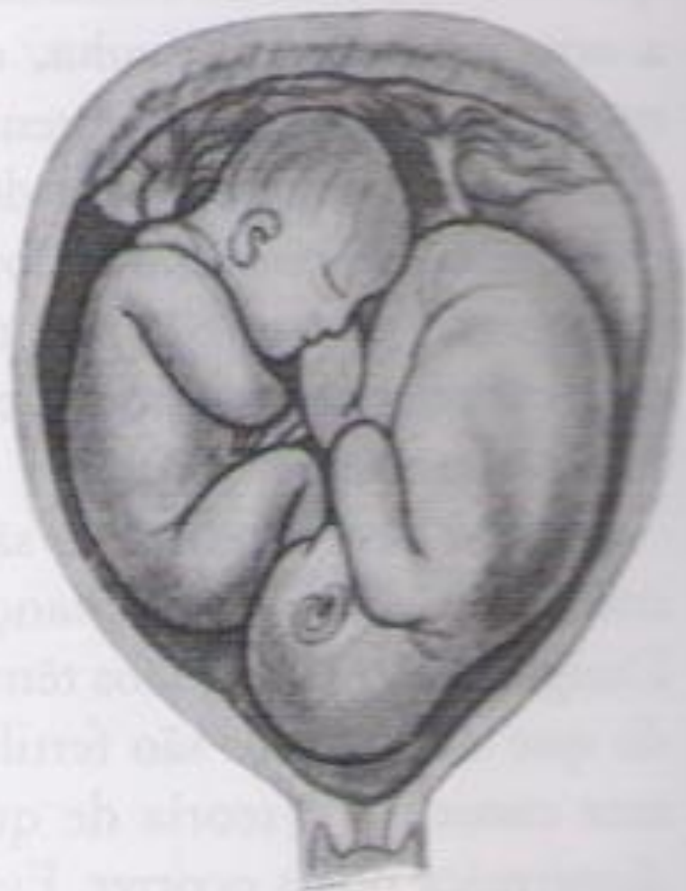
Figura II-3 – Prenhez gemelar monozigótica monoâmnica. Placenta, cório e âmnio únicos (Briquet, 1939).